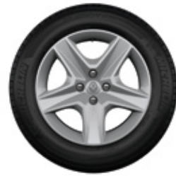
Llantas Flexwheel Oasis 16"