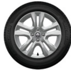
Llantas de aleación Jogger 16"